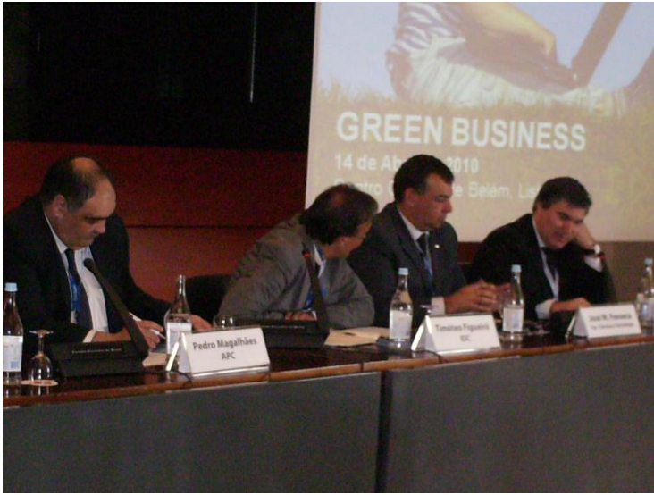
Painel de oradores